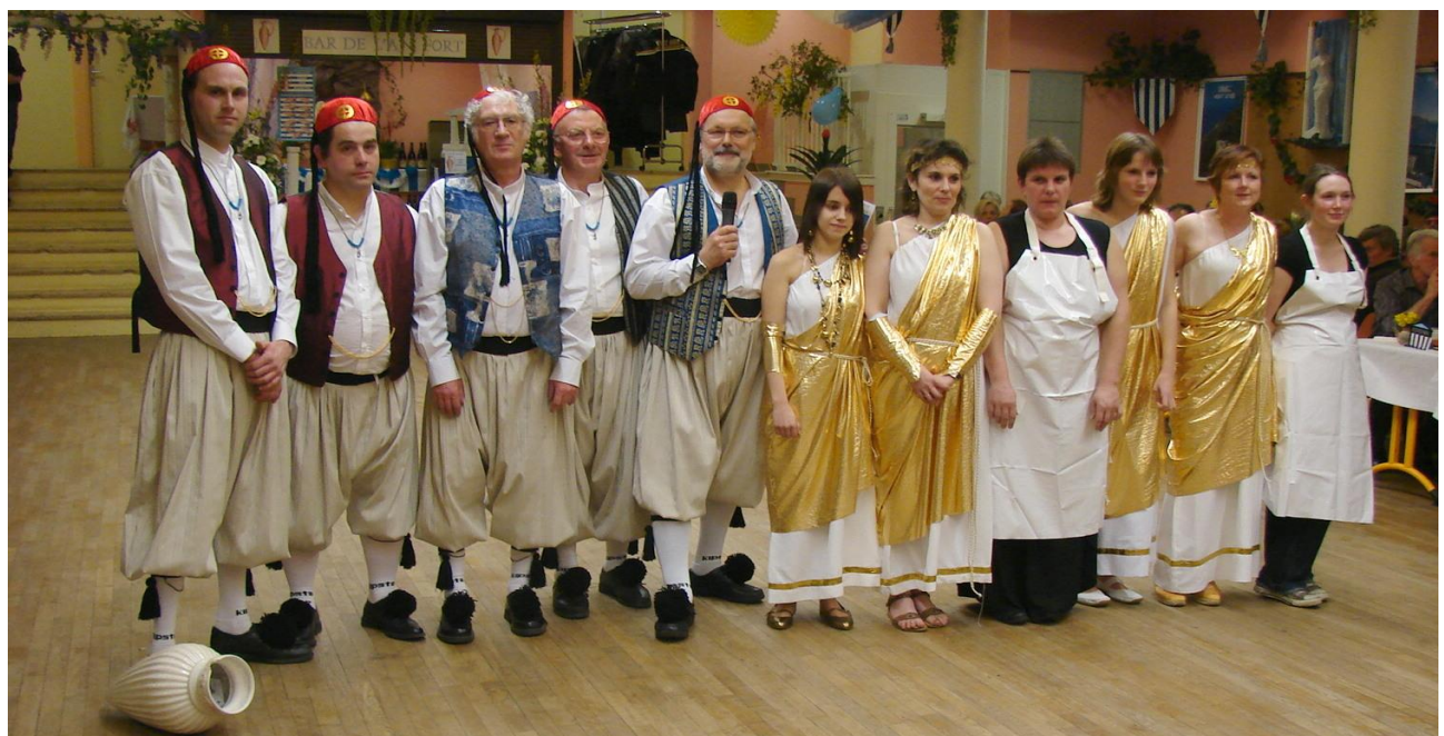
L'équipe du comité des fêtes de Chaumont durant le dîner dansant salle le Tahiti de Gacé thème : la Grèce