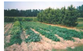
Champ de Soja en Caroline du Nord