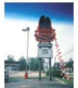
Restauration rapide en Caroline du Nord